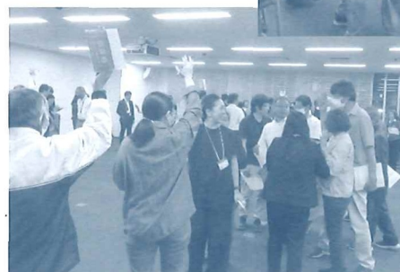
第1回 ワークショップの様子 二人で割り箸を持って 回ったり、チーム対抗 で並び替え競争したり と交流を深めました。