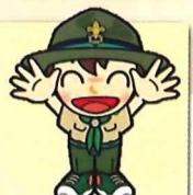
ボーイ隊 (小学 6～中学生 年代)