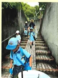
こみ拾いの後の流しそめ んは最高！