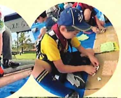
↑ 鞍ヶ池公園での森と緑づくり プログラム