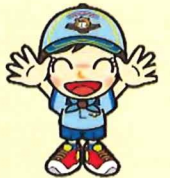
ビーバー隊 (小学 1～2 年生)