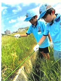
↓ ザリガニ釣れたかな