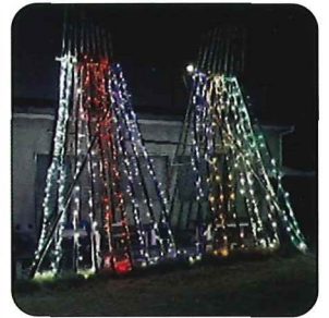
クラブハウス イルミネーション