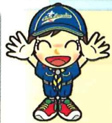
カブ隊 (小学 3～5 年生)