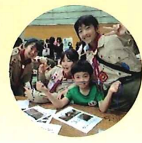
↑ わくわくワールド